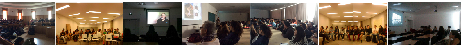
Participación del alumnado en las actividades transversales propuestas en los distintos proyectos: conferencias, seminario, ciclo de cine y mesas de debate.