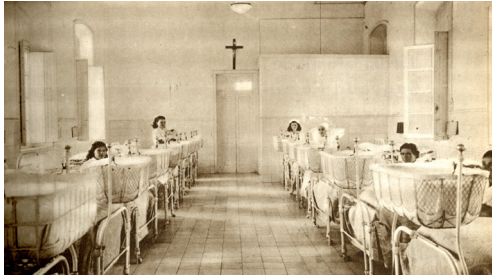
Imagen 1: Sala de partos del Hospital Civil de la Beneficencia de Santa Cruz de Tenerife (años 30 del siglo XX)

En 1934, con la Ley de Bases de Régimen Sanitario y la posterior Orden Ministerial de 13 de febrero de 1936 relacionados con la creación de un sistema sanitario, se enfatizó la intervención estatal en la organización de los servicios sanitarios locales, además de la reestructuración de los “desconocidos” centros primarios y secundarios de Higiene Rural. Ambos textos normativos buscaban la constitución de una red asistencial sanitaria, en la que se primara la prevención, la educación para la salud, la curación, la rehabilitación y la reinserción del individuo. Para lograr su objetivo, se dispusieron dispositivos sanitarios como los Centros Primarios y Secundarios de Higiene Rural (reorganizados y con una nueva interpretación), los Servicios de Higiene Infantil dependientes de los Institutos Provinciales de Higiene, los dispensarios móviles de Higiene Infantil, los dispensarios y sanatorios para la lucha antituberculosa-antivenérea, la Escuela Nacional de Sanidad, así como la creación de una Escuela Nacional de Enfermeras Visitadoras (García 2012; Alberdi, 2016).