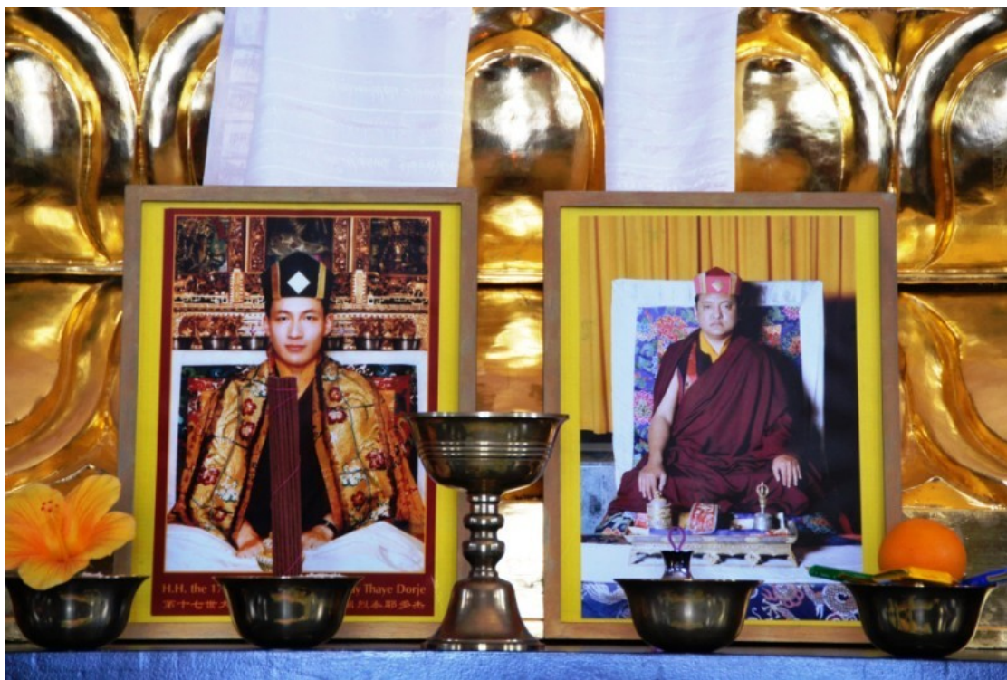
Fotos del Karmapa Trinley Thaye Dorje y del Sharmapa al pie de la estatua de Buda que preside el estupa de Benalmádena