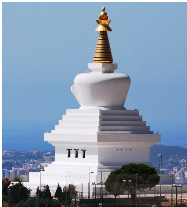
Monumentalidad del estupa de Benalmádena

habitual en las guías turísticas y en los folletos que publican muchas compañías aéreas que operan en el muy concurrido aeropuerto de Málaga. Tiene 33 metros de altura lo que lo convierte en el mayor monumento de su tipo fuera de Asia y fue construido en terreno cedido por el ayuntamiento de Benalmádena, que también financió la mitad de los gastos de la construcción (una práctica muy excepcional, por otra parte); todo ello se hizo en la época en la que Enrique Bolín fue alcalde de la ciudad en calidad de independiente (1995-2007).