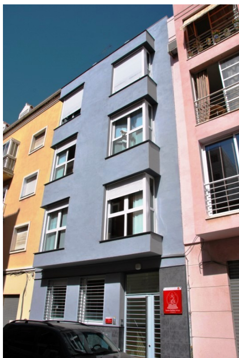
Sede de Diamondway en Málaga