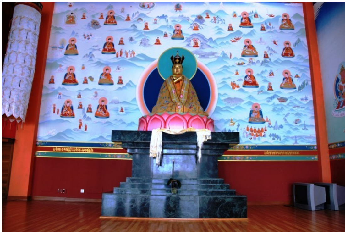
Gompa Thaye Dorje. Estatua del XVI Karmapa y mural con los Karmapas

Otro hito muy destacado en la visibilización de Diamondway en España fue la inauguración en octubre de 2003 del estupa de la Iluminación en Benalmádena (Málaga, web: http://www.stupabenalmadena.org ), obra monumental muy destacada que incluso ha recibido premios de arquitectura y es referencia