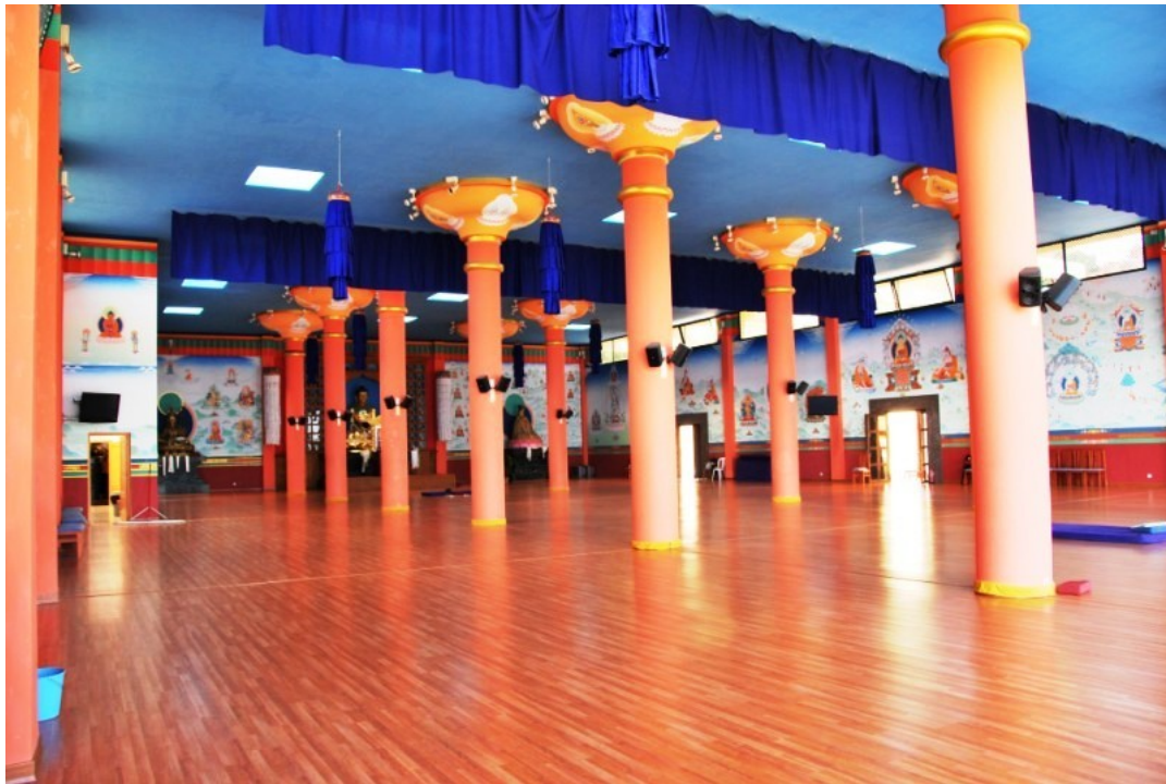
Gompa Thaye Dorje, al fondo las estatuas de culto