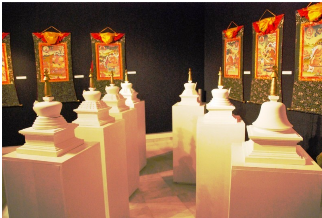
Sótano del estupa. Museo, modelos de estupas y tankas con los Karmapas

visitantes se situaba en torno a 500 personas diarias, y aún mantiene ese nivel de visitas en las fechas vacacionales.