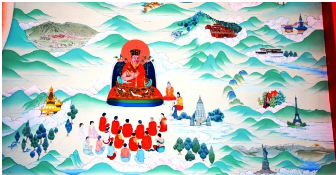
Gompa Thaye Dorje. Pintura mural con representación del XVI Karmapa promoviendo el desarrollo del linaje por todo el mundo

1980 y parece que potenciará la visibilización del panorama cada vez más multirreligioso que caracteriza a la sociedad española.