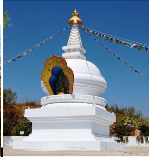
Vista de Karma Guen desde el estupa de Kalachakra / Estupa de Kalachakra